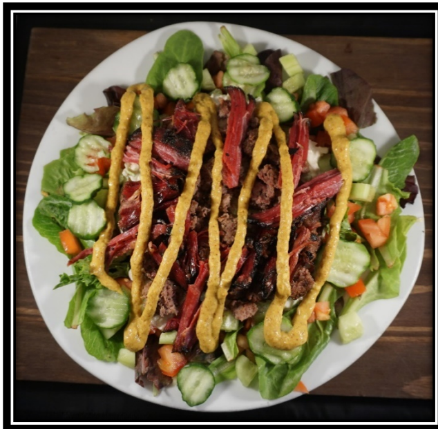
New Yorker Salad - $29

Carne de Res. Pastrami. Repollo Blanco en Mayonesa Cremosa. Pepinillos. Mostaza de Rábano Picante (No Pica).