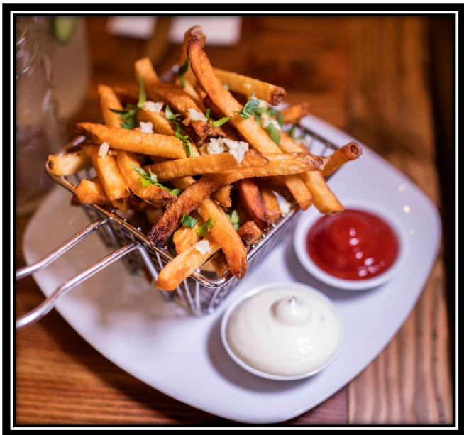
Hand-Cut Truffle Fries $14