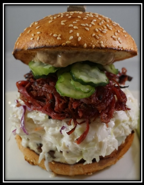
New Yorker - $27

Beef Patty. Navel Pastrami. White Cabbage. Pickles. Horseradish Mustard.