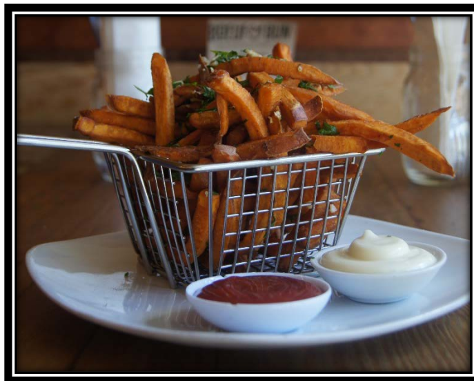
Sweet Potato Fries $15

Papas fritas con salsa de tomate y trufa de alioli