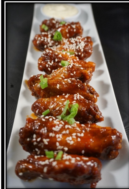
Hot Wings $15