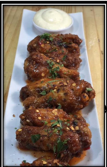
B&B Wings $15